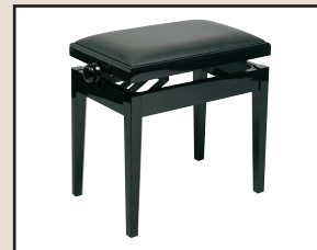
B 501 H