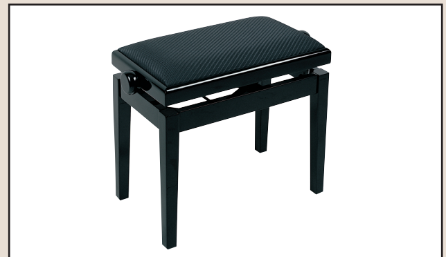
Mod. B 5 H