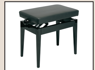
B 500 H