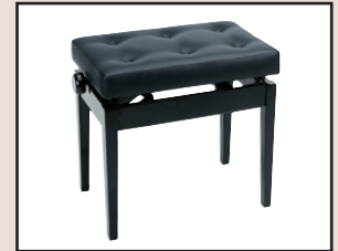
B 500 AH