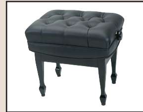
B 10 Professional H